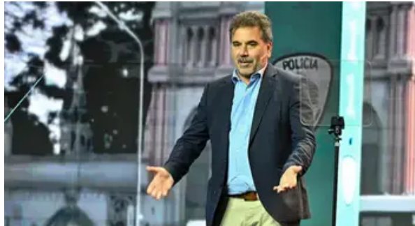
Ritondo adelantó que el PRO mantendrá la alianza con LLA en la provincia de Buenos Aires en 2027