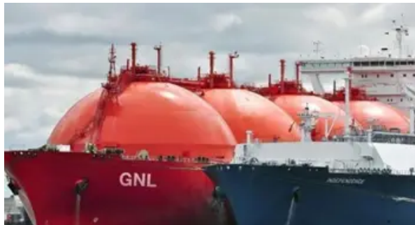
La guerra en Medio Oriente complica la importación de gas para el invierno