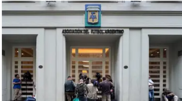
Allanan la AFA en busca de documentación vinculada a negocios con la empresa de Faroni