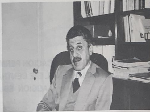
Juan Carlos Tedesco, Director de la Oficina Regional de Educación para América Latina y el Caribe.

Juan Carlos Tedesco, nacido el año 1944 en Argentina tiene un nutrido currículo. Ha sido profesor en la Universidad Nacional de La Plata; Director del Departamento de Planeamiento y Pedagogía Universitaria de la Universidad de la Pampa en su país; Director de la Biblioteca de Cultura Pedagógica; Director del Centro Regional para la Enseñanza Superior de América Latina y el Caribe entre otros cargos.