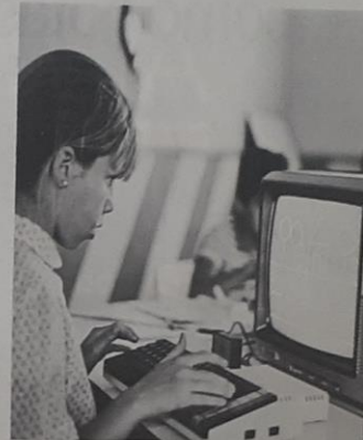
Hay condiciones propicias para compatibilizar la educación tecnológica y humanista.

Por otra parte, el concepto de educación permanente implica un cambio en el eje central de la acción educativa. El Centro del proceso de