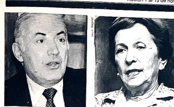
Informe: Jorge G. Lama